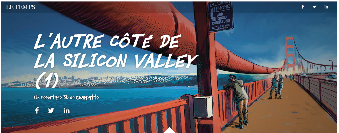
© Chappatte in Le Temps, Genève